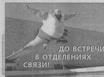
ДО ВСТРЕЧИ В ОТДЕЛЕНИЯХ СВЯЗИ!