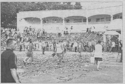
Праздничный антураж хабаровского стадиона первой половины чемпионата

- Обязательно играть в боулинг, послушать хорошую музыку. Еще больше посылать у телевизора во время отпусков. За сезон устать, хочется поваще с родителями побыть. Старше больше находиться дома. Есть у меня и девушка, но с жингеле пока не задумывался - по-моему, рано.