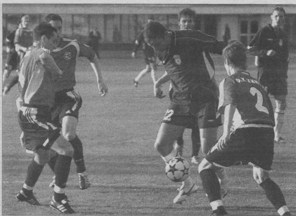
В окружении четырех соперников из «Химок». Фото саратовского периода карьеры