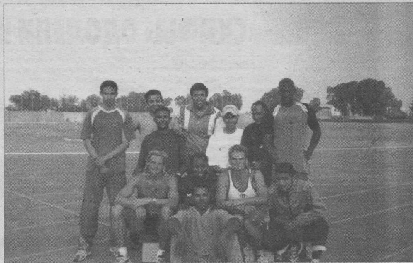
2001 год. С легкоатлетами сборной Ливии