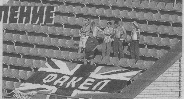
Считанных минут не хватало «Факелу» в Брянске, чтобы порадовать свой фанатский десант гостевой ничьей. А вот в Орле воронежцы поражения не допустили.