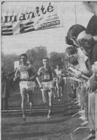
1968 год. Франция. Кросс на призы газеты «Юманите»

и в гостинице. Рядом в зале и то «под ковном» купались. Вечером не разрешили выходить - только в сопровождении. Фотоаппараты отбирали, засвечивали пленки. И все это четко делали «черные полковники». Не знаю, кто их так назвал, но форма у них была очень красивой. Благодаря этим повыше-