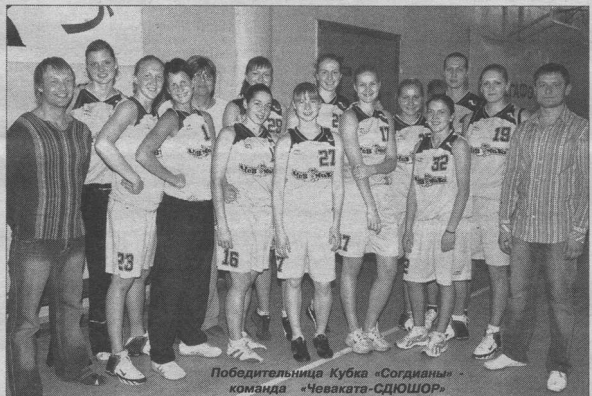
Победительница Кубка «Согдианы» - команда «Чеваката-СДЮШОР»

Кубок «Согдианы» заверен, первый блин комом не вышел. А кто-то думал, что будет иначе? Организаторы не против предложить хорошее название. Не удивлюсь, если через год в нашей газете вы прочтаете «скоро стартует традиционный турнир Кубок «Согдианы», можно даже добавить «международный». Не верите? Уверю, так и будет, ведь в Воронеж уже в этом году извлязла желание приехать команда из Жемляна.