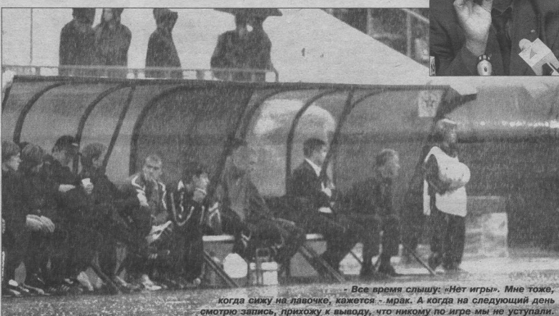
- Все время слышу: «Нет игры». Мне тоже, когда сижу на лавочке, кажется - мрак. А когда на следующий день смотрю запись, прихожу к выводу, что никому по игре мы не уступали.