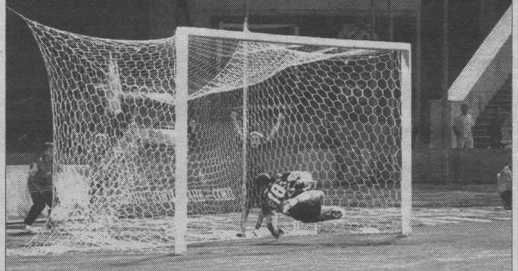
3:0. На этот раз штанга сыграла на стороне Соловьева, однако против добивания он бессилен