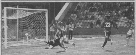
4:0. Янбаев забивает после «стеночки» со Стрелковым, исполнившим пас пяткой