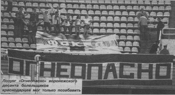
Лозунг «Огнеопасно» воронежского десанта болельщиков краснодарцев мог только позавидеть