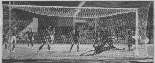
1:0. После розыгрыша штрафного мяч ricochet в штангу и влетает в сетку