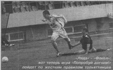
«Лада» - «Факел» вот теперь игра «Попробуй догони!» пойдет по жестким правилам толстятников