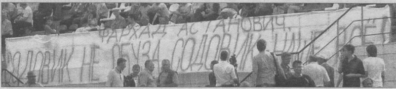
Болельщики «Содовика» забили тревогу еще во время сезона. Данный баннер они адресовали генеральному директору ОАО «Сода» Фархадю Самедову. А сейчас они бомбардируют своими посланиями различные инстанции, вплоть до администрации Президента РФ.