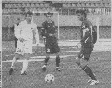
Подробности и статистика голевых туров третьего дивизиона «Черноземье» - на стр. 7.