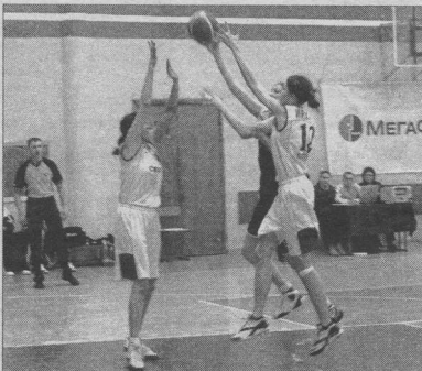
35-й тур. ТВЕРИЧАНКА-2000 - СОГДИАНА-СКИФ 63:75. Шелен-ЕТК-2 - Динамо-2 М 69:72 10т, Нефтяник - Чеваката-СДОУШОР 81:95, ВБМ-СГАУ - Надежда-2 60:57, НУР-2 - Спартак Пн 55:77, Динамо-2 МО - Динамо-2 К 74:53, УТМК-Юниор - Спартак-ШВСМ 59:100, Славянка-ЧКПЗ - Энергия 91:70. 36-й тур. ДИНАМО-2 МО - СОГДИАНА-СКИФ 73:68 20т, Славянка-ЧКПЗ - Спартак-ШВСМ 90:65, УТМК-Юниор - Энергия 59:69, Спартак Нг - Глория 91:57, Тверичанка-2000 - Динамо-2 К 105:83, Нефтяник - Динамо-2 М 96:73, Шелен-ЕТК-2 - Чеваката-СДОУШОР 78:69, НУР-2 - Надежда-2 44:60, ВБМ-СГАУ - Спартак Пн 70:75.