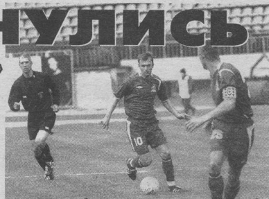
ФУТБОЛ // ТРЕТИЙ ДИВИЗИОН // «ЧЕРНОЗЕМЬЕ»