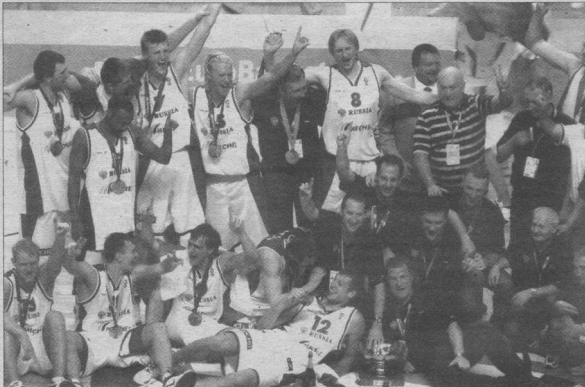
Россия ликует после победы в финале «Евробаскета-2007» над испанцами