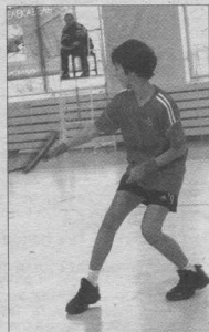
Шоттенису все возрасты покорны

россиянина разработали концепцию создания нового вида спорта на теннисном корте. 15 октября 2001 года был получен приоритет России на новый способ игры в теннис. Год спустя в Санкт-Петербурге создана федерация шоттениса, еще через год получено авторство, как на новый вид спорта. Таким образом в на-