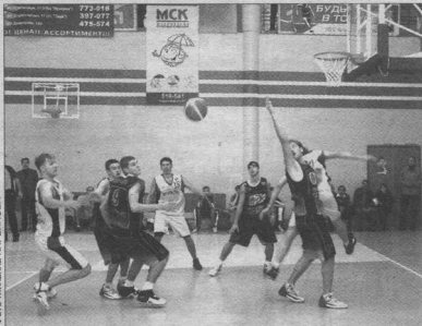
На подборе «скифы» сопернику спуска не давали

А вот повторный матч для воронежцев прошел гораздо спокойнее. Небольшое преимущество, добытое в первой четверти, в следующем периоде «скифы» серьезно увеличили. впечатляющий рывок был сделан в самом начале второй 10-минутки, которое наша команда безоговорочно выиграла - 16:0. При этом 11 очков в этой четверти на