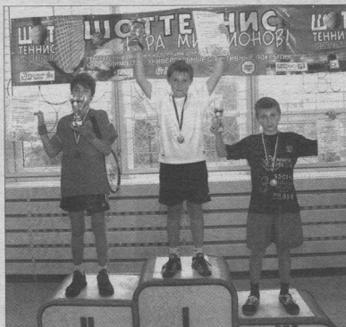
Победители и призеры чемпионата Воронежа

Это синтез двух дисциплин - игра на теннисном корте по правилам настольного тенниса. Он демонстрирует все лучшие качества универсальной и доступной для всех игры, независимо от спортивных достижений и теннисной подготовки, комплексации и ритма жизни. В шоттенис можно играть на любой ровной площадке ракетками для большого тенниса. Правила и техника ударов достаточно просты. Эта игра доставляет занимающимся огромное удовольствие от движения и возможности добиться солидных результатов за сравнительно небольшое время обучения.