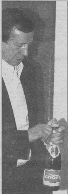
Юрий Семин и Виталий Мутко на вручении Премии РФС 25 декабря 2007 года.

- Станьте за мной, вы оба. У них во все время команд нет ни одного приличного игрока. (О.Генри, «Короли и капуста», 1904 г.). Не правда ли, напоминают примененному ныне схему с одним чистым форвардом при двух «под нападающих»? Сколько же всяких тактических систем в этой динамичной игре! Футбольная жизнь продолжается. Будет еще и рухнувшие надежды, и всевозможные чудеса.