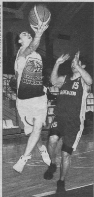
«Скифы» вернулись из города металлургов не с пустыми руками