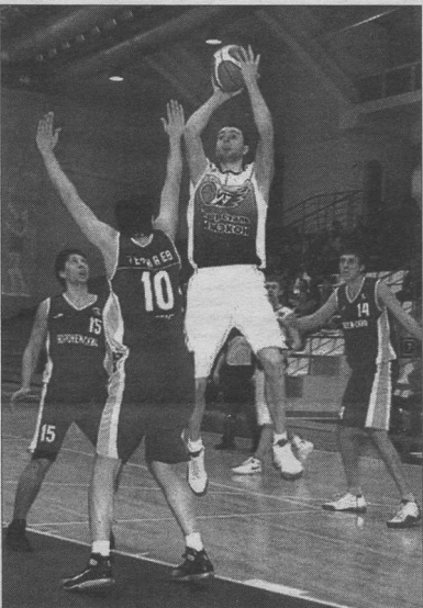
СДЮСШОР Тольятти - ВОРОНЕЖ-СКИФ

И первая игра со СДЮСШОР - яркое место подтверждение. «Скифы» без особых проблем расправились с хозяевами, не отдав ни одной четверти. А повторный матч, причем уже не в первый раз, воронежцы провели не столь убедительно. С самого начала игра у гостей не заладилась, чего только и ждали тольяттинцы, принявшиеся по крупицам наращивать свое преимущество. Игроки СКИФа пришли в себя лишь к четвертой четверти и сумели не только догнать соперника, но и выйти вперед. У «скифов» был отличный шанс избежать овертайма, но где-то не хватило меткости, где-то сказались ошибки в обороне - и добро пожаловать в дополнительное 5-минутку! Но в «бонусном» периоде гостям не удалось проложить ни малейшего - тольяттинцы сумели склонить чашу весов в свою сторону.