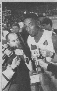
Приезд Пиппена на «Матч всех звезд» АСБ вызвал огромный интерес

ку красивым броском сверху. Наша команда так и действовала, а вот соперники играли строго на результат. Превращать матч в шоу «Восток» желанием не горел. Нам не хватило самой малости, проиграли — 73:76. Да и судьи симпатизировали хозяевам. Как говорится, в Техасе должен победить Техас (улыбается). — После «Матча всех звезд» вернулись домой не сразу. — Остался в Перми на традиционный сбор, которым руководил наш прославленный баскетболист, тренер студенческой сборной России Сергей Александрович Белов. Тренировки проходили очень интересно и больше напоминали игру — каждый старался на полную катушку, стараясь показать все, на что способен. Ведь именно Белов будет формировать студенческую сборную, и четыре места в ней достанутся ребятам из АСБ. Теперь же постараюсь по-