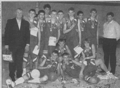
В своем дебютном сезоне «Спартак» сумел все удивить и завоевать «золото» МБА