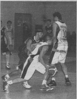
«Скифам» удалось пробиться в финал высшей лиги «Б»

В отличие от состоявшегося неделей ранее поединка в Тамбове, на этот раз соперники сыграли весьма результативно. Как ни старались воронежцы, а решить свою главную задачу в первый игровой день им не удалось. В решающий момент встречи чуть точнее оказались волжане.