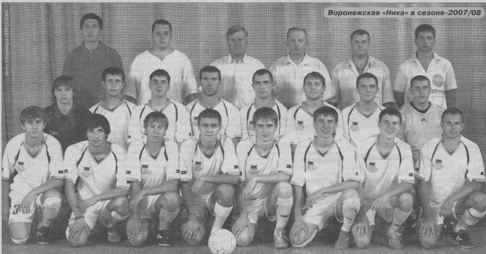
Воронежская «Ника» в сезоне-2007/08

Каким будет состав и какие задачи поставит руководство перед командой в следующем сезоне, пока сказать сложно. Многое будет зависеть от финансирования и от внимания со стороны властей. Руководство клуба прилагает максимум усилий, чтобы Воронежская область прописалась на мини-футбольной карте России всерьез и надолго.