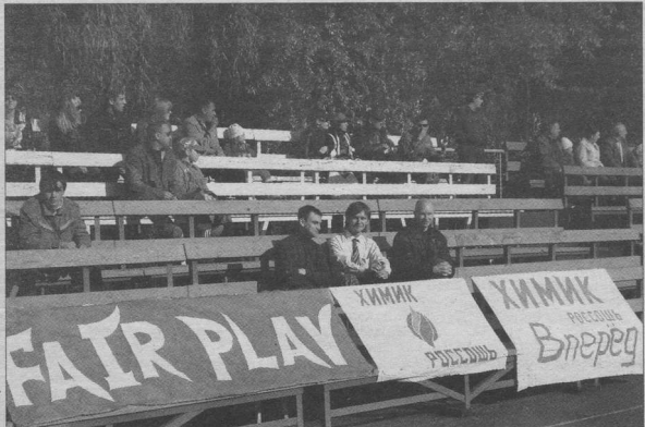
ХИМИК-РОССОШ - ФАКЕЛ-СТРОЙ АРТ Воронеж 0:3 (0:0)

Матч 2-го тура. 21 мая. Русичи-2 - ДЮСШ-Динамо. Матч 5-го тура. 22 мая. Химик-Россош - ФШЦ-73-Д. 8-й тур. 24 мая. ДЮСШ-Динамо - Факел-СтройАрт - Текстильщик, ФК Смоленск - Хопер. 25 мая. ФШЦ-73-Д, УОР, Горняк - Химик-Россош, Рязанская ГРС - Дон, СК Смоленск - Цемент, Русичи-2 - Арсенал-Тула, Магнит - МИК.