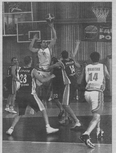
Атаку, тамбовчане (в светлой форме) лишь иногда чувствовали себя хозяевами положения

ЖЕНЩИНЫ // МЕЖДУНАРОДНЫЙ ТУРНИР КУБОК «СОГДИАНЫ»