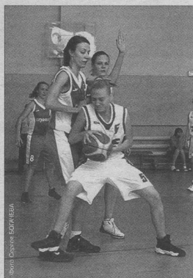
Игроки «Ники» с большим трудом подбирались к кольцу хозяек