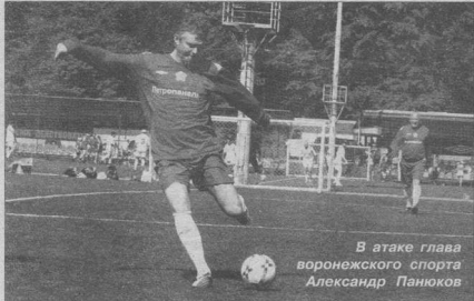
В атаке глава воронежского спорта Александр Панюков