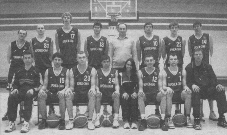
Баскетбольный клуб «Воронеж-СКИФ» — серебрянный призер высшей лиги «Б» первенства России-2007/08

Специм обрадовать болельщиков «скифов», которые совсем скоро получат возможность наблюдать за игрой своей любимой команды. С 11 по 13 июля в Воронеже пройдет мужской Кубок «Согдиана», организационный к приезду в столицу Черноземья сборной баскетболистов-миссионеров из Северной Америки «Атлеты в действии», посещающих наш город уже не один раз. Помимо «скифов» и американского коллектива в соревнованиях примут участие БК «Липецк» и «ГУ. Тамбов» (последние планируют