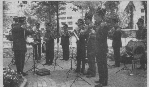
Гостей «Незабудки» в СК «Согдиана» встречал духовой оркестр