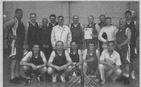
Коллектив Воронежа - один из двух победителей «Незабудки»

СЕТЬ МАГАЗИНОВ ОТДЕЛОЧНЫХ МАТЕРИАЛОВ «СОГДИАНА» В ВОРОНЕЖЕ: ДОНБАССКАЯ, 21 ☎ 77-30-16 • ДИМИТРОВА, 120 ☎ 47-55-74 • ЛЕНИНСКИЙ пр-т, 158/2 ☎ 23-53-66