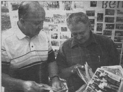
Рассматривая фотографии прошлых лет, ветераны вспоминают молодость