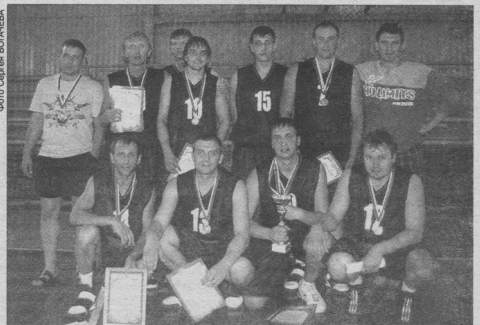
Баскетболисты Нововоронежа - чемпионы XX Спартакиады

В турнире женщин был явный фаворит - команда хозяев, которая отстаивала чемпионское звание, доби-