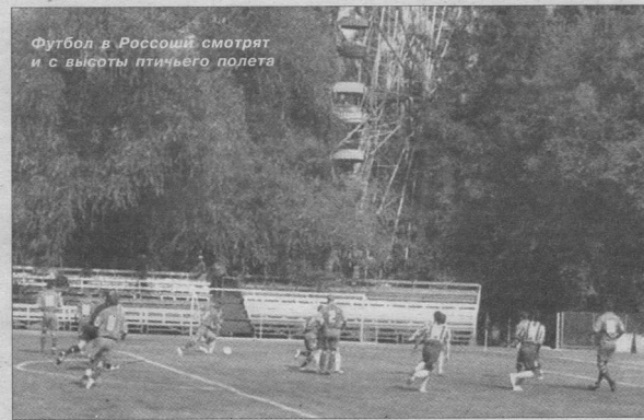
Футбол в Россоши смотрят и с выгоды питьевого ледя