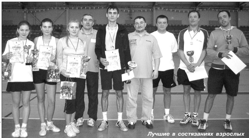
Лучшие в состязаниях взрослых