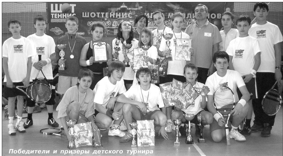
Победители и призеры детского турнира