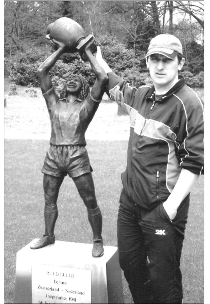
Голландия. Национальная академия футбола. Аллея знаменитых футболистов. Памятник Руду Гуллиту

- Это очень интересный момент. На Западе давно выработали такую схему: люди, которые не заиграли на высоком уровне, должны оставаться в сфере футбольного влияния. Через несколько лет человек может стать бизнесменом, который будет вкладывать в футбол деньги. У него родится сын, которого он приведет на стадион в детскую школу. Именно поэтому Голландия, Испания и Италия буквально живут футболом. Там никому не отказывают, в любительских командах играют все желающие: толстые, в очках, маленькие.