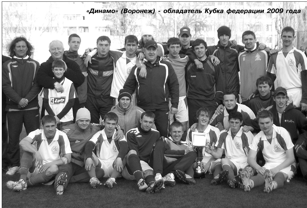
«Динамо» (Воронеж) - обладатель Кубка федерации 2009 года