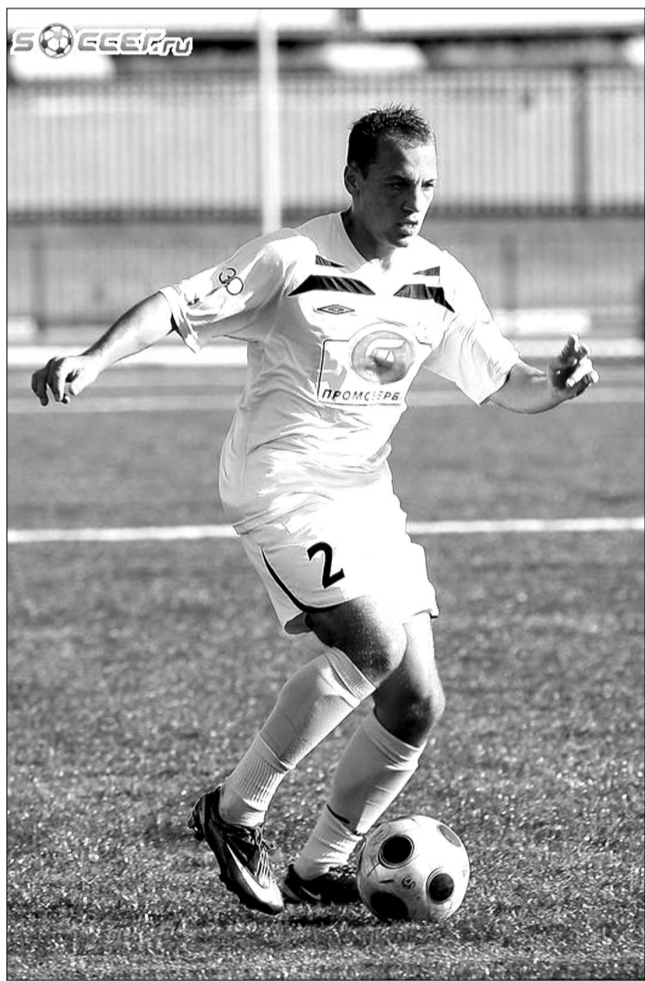
С момента предыдущего приезда в Воронеж на матч с «Факелом-Воронеж» подольская команда обзавелась спонсорским логотипом на груди