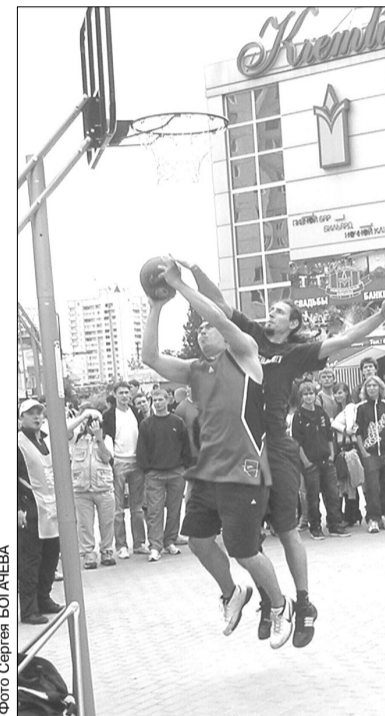
Фрагменты финального поединка в категории «1989 г.р. и старше» между командами «Вазелин» и «Бродвей паб»

ководители города, области и страны, в первую очередь поздравившие всех участников с Днем физкультурника и пожелавшие спортсменам удачи в стритбольных баталиях. Не обошлось и без показательных выступлений воронежских гимнастов и акробатов.