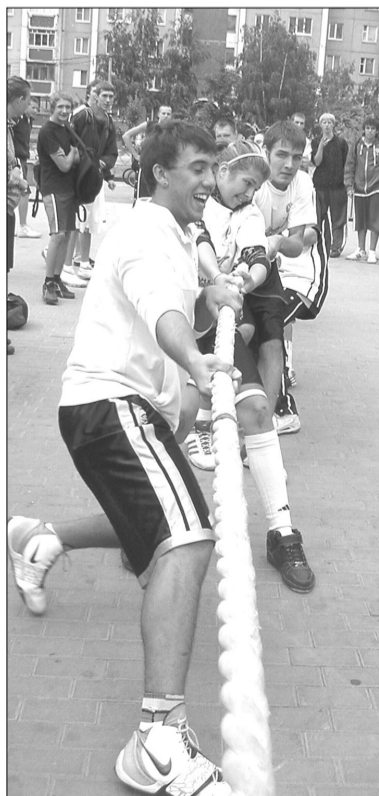
В перерывах между матчами стритболисты весело соревновались в перетягивании каната