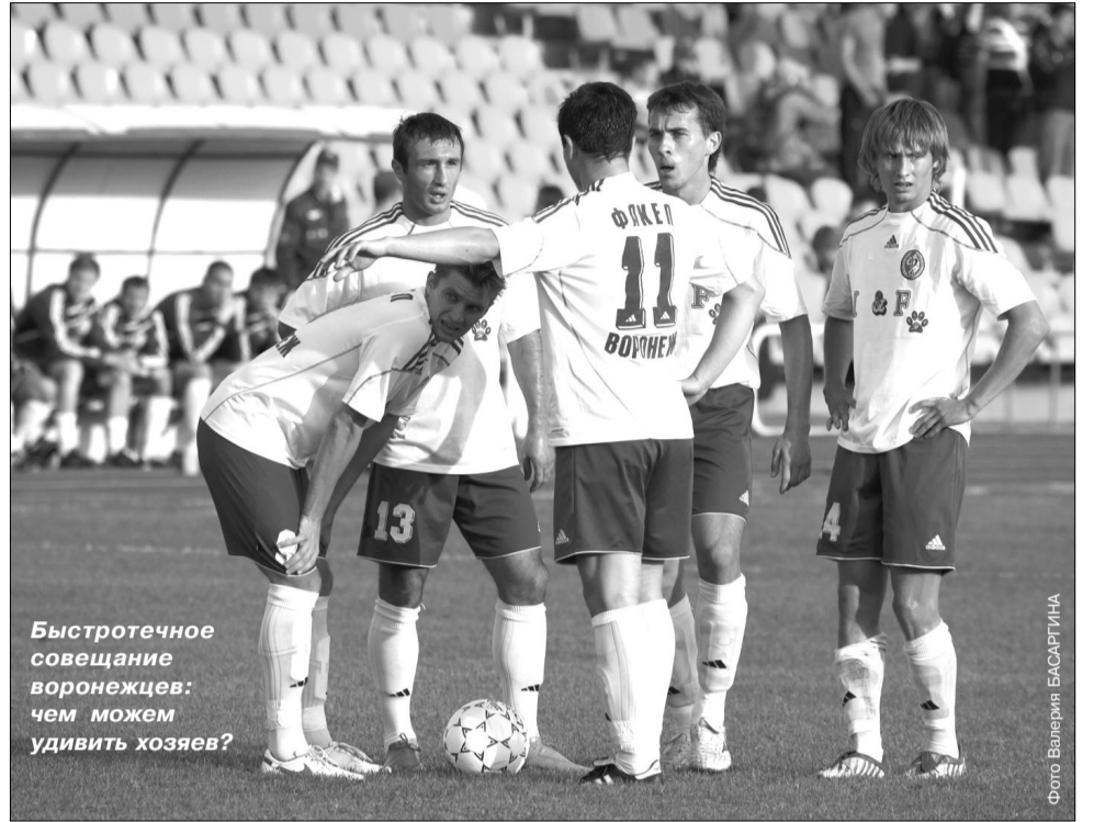
Быстротечное совещание воронежцев: чем можем удивить хозяев?