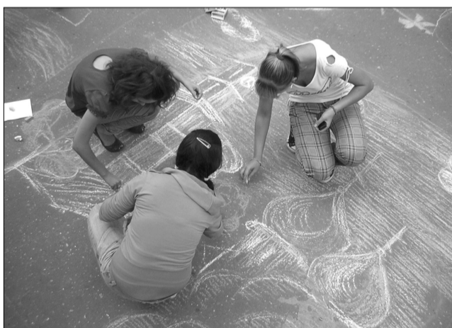
Конкурс рисунков на асфальте в самом разгаре