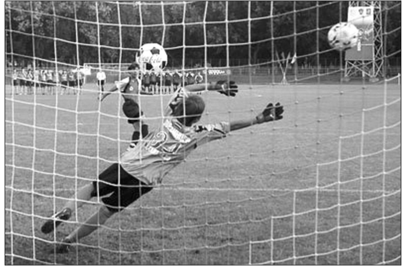
Послематчевые пенальти. Удар в ворота «Темпа»