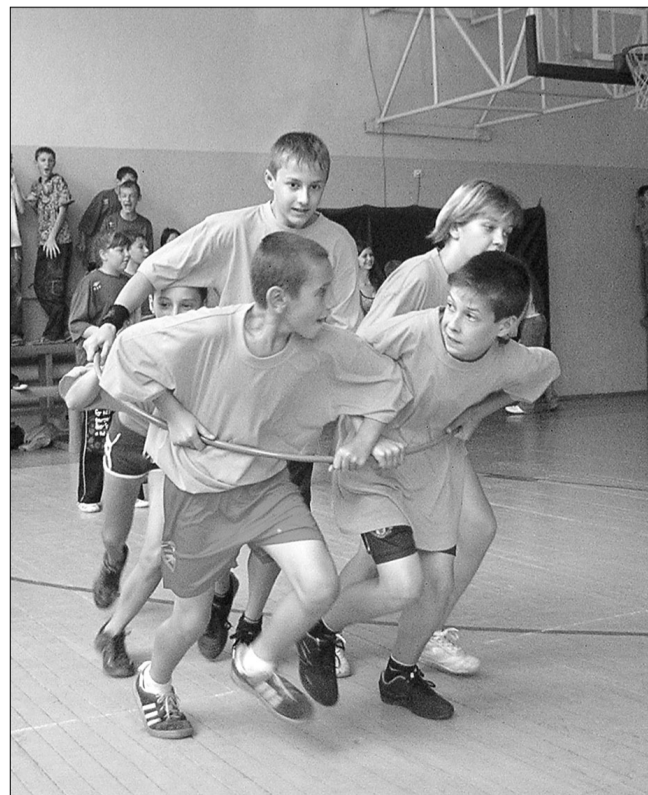
Команда МОУ СОШ № 97 - один за всех и все за одного