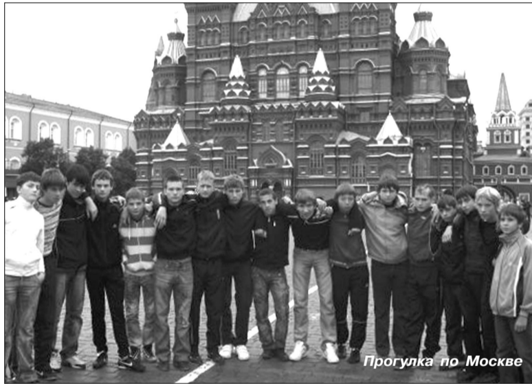
Прогулка по Москве