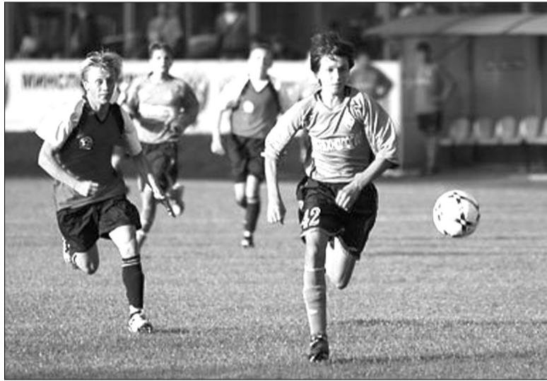
Финал. «Темп» атакует