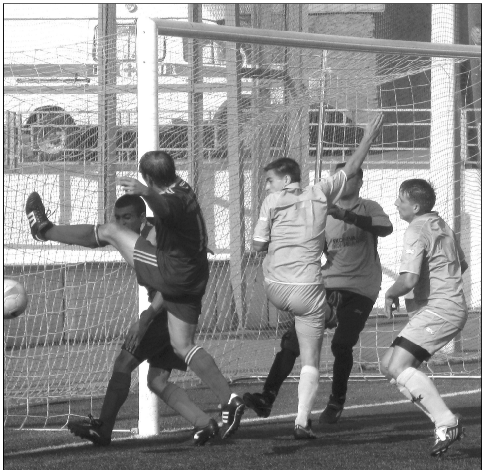
Футбольные баталии на «Восточном» продолжались три дня подряд