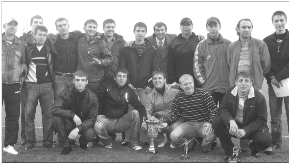
Футболисты «Эко-Нивы-Агро» из Колыбелки - с Кубком победителя

колхозные и совхозные команды. В крайнем случае, коллектив сахарного завода Ольховатки. А в последние годы наметилась тенденция, когда на соревнования заявляются команды райцентров. Винить их за это нельзя, видно, лучше достойно выглядеть в сельских соревнованиях, чем плестись в хвосте таблицы чемпионата области. В том же Богучаре делают ставку на своих