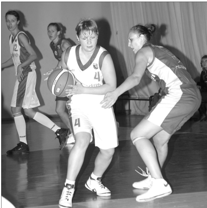
В матче с «Викторией» «Согдиана-СКИФ» не испытала особых проблем

Мало кто сомневался в благоприятном для хозяек исходе двухматчевого противостояния с «Викторией». Это в прошлом сезоне волжанки были серьезными соперницами, а вот в этом году саратовские баскетболистки больше подходят эпитет «девочки для битвы». Главная интрига поединков - с какой разницей в счете воронежцы возьмут верх над командой гостей, в которой выступают исключительно школьницы.