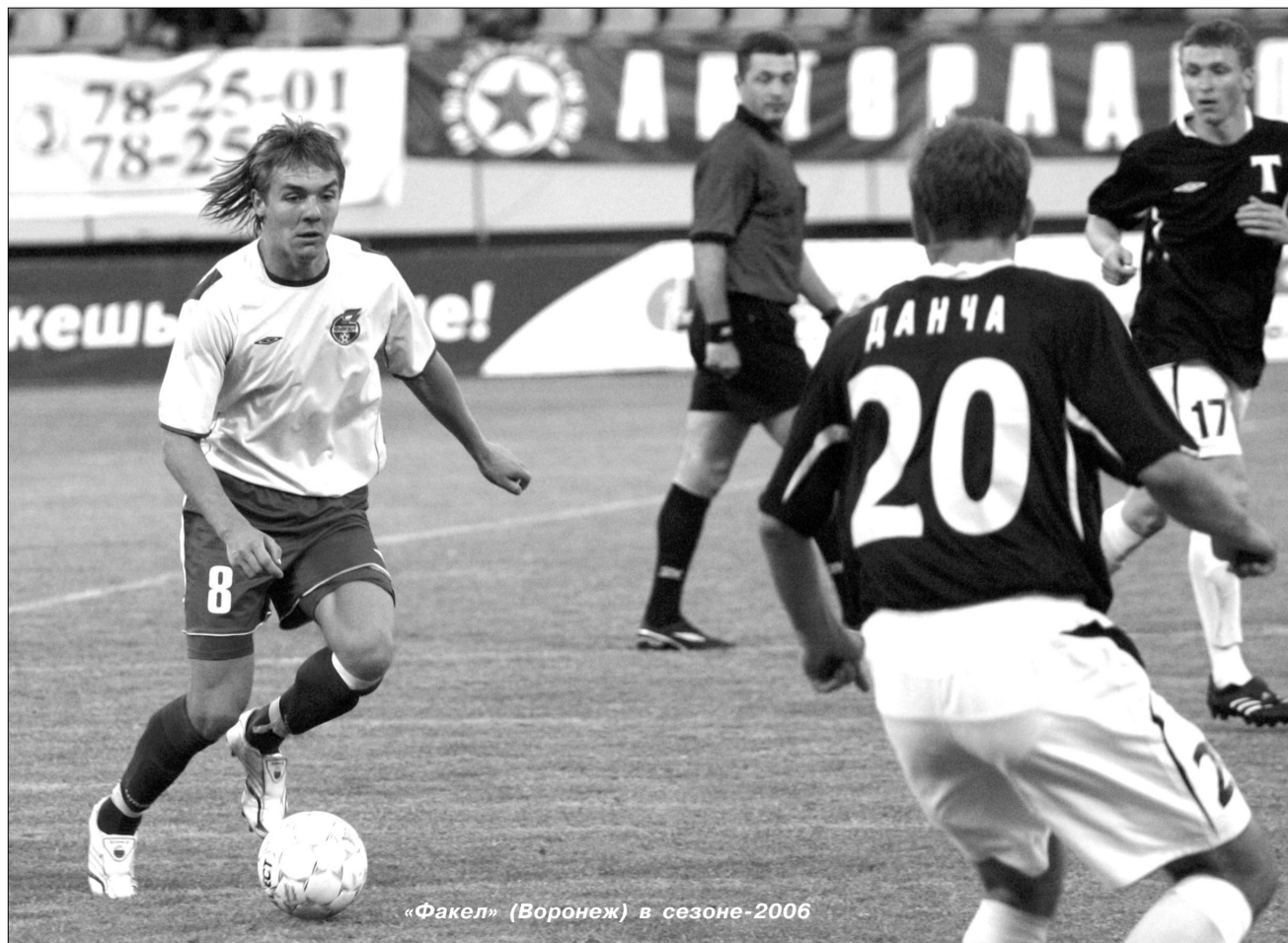
«Факел» (Воронеж) в сезоне-2006