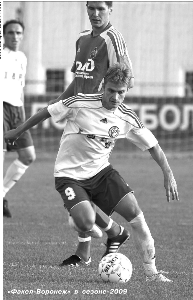
«Факел-Воронеж» в сезоне-2009