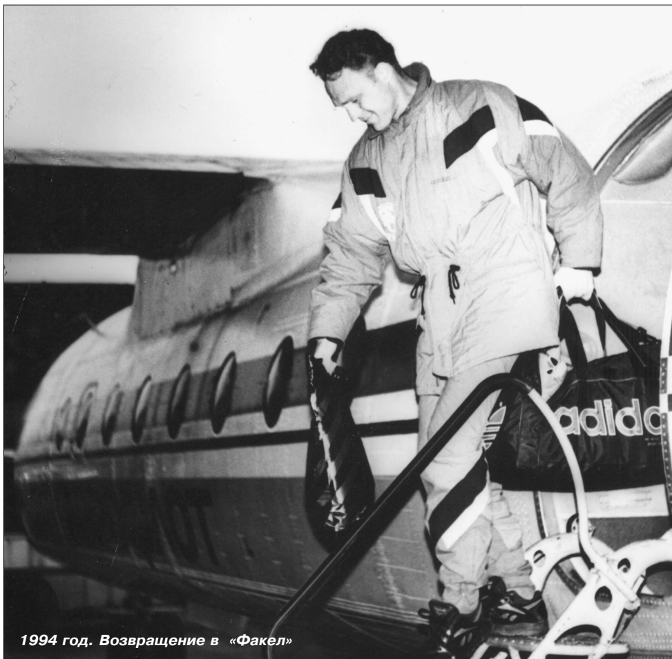
1994 год. Возвращение в «Факел»

тов можно было поучиться. Негативные матчи тоже, конечно, были, но я старался сразу о них забыть и никогда не вспоминать. Уверен, что всегда надо делать надлежащие выводы и необходимые