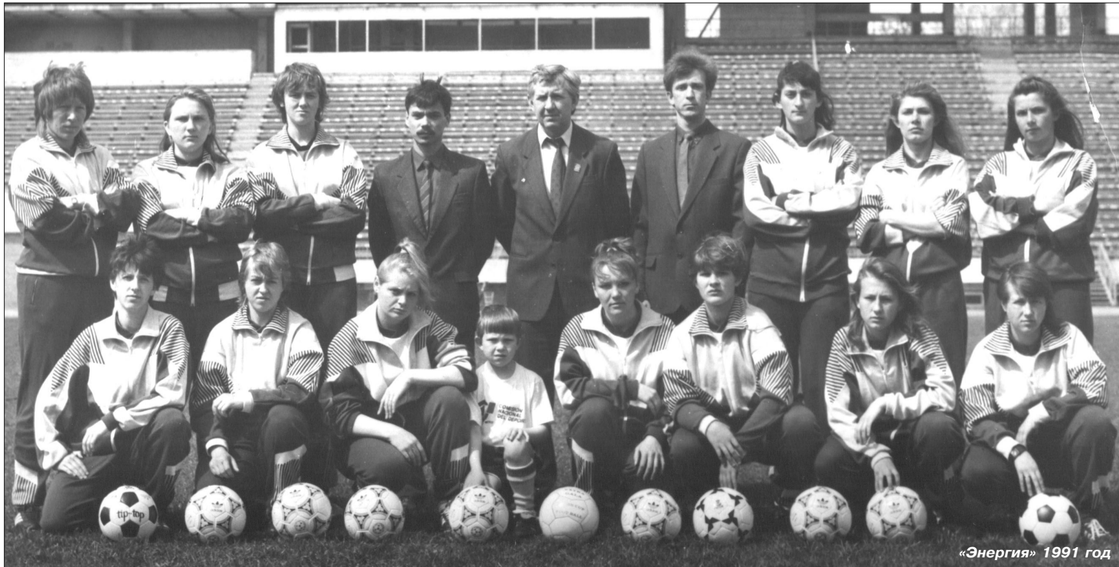
«Энергия» 1991 год

- Положительной. Кто-то пришел на стадион ради экзотики, но всем понравилось. Не зря в России Воронеж одно время был первым по посещаемости. Только потом нас обошла Рязань. Отлично помню, как в 1991 году на кубковый финал в Подмоскowie мы решили организовать «чартерный» плацкартный вагон. Так желающих набралось столько, что не осталось ни одного свободного места. Болельщики приехали с гармошками, концерн делегировал ансамбль. Такой поддержки в женском футболе не было ни у одного клуба в России.