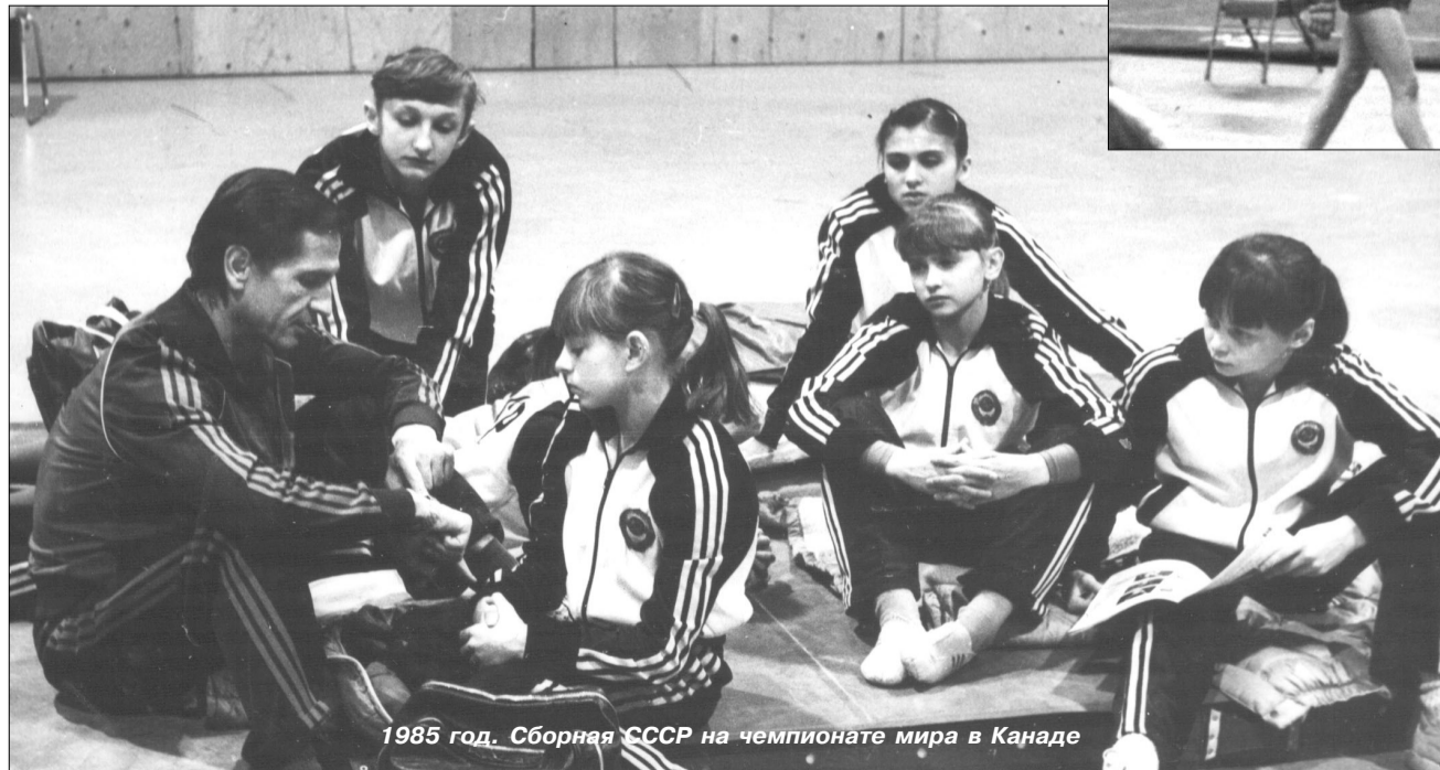
1985 год. Сборная СССР на чемпионате мира в Канаде