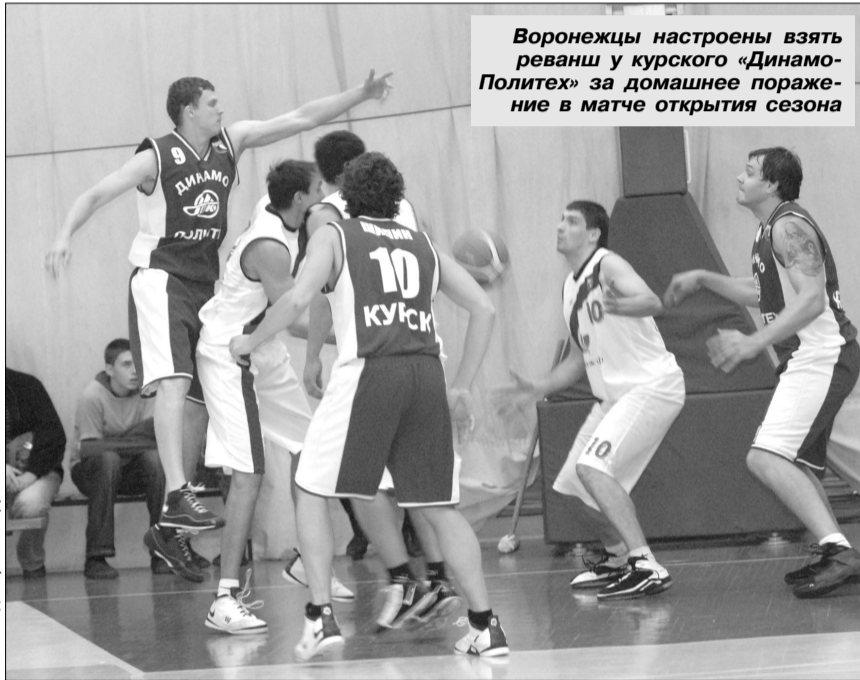
Воронежцы настроены взять реванш у курского «Динамо-Политех» за домашнее поражение в матче открытия сезона

ДИНАМО-СТАВРОПОЛЬ - ВОРОНЕЖ-СКИФ 75:81 (23:24, 12:22, 24:19, 16:16) 85:87 (21:26, 21:28, 22:14, 21:19) ДИНАМО-СТАВРОПОЛЬ: Олейников (13+22), Блюм (19+23), Мельников (7+4), Соснин (5+1), Самофалов (4+6). На замену выходили: Янютин (11+20), Вараксин (2+0), Полухин (12+3), Ломонос (2+3), Костин (0+3). ВОРОНЕЖ-СКИФ: Рогачев (14+24), Ерышов (7+7), Бжевский (17+18), Кислянский (12+7), Горожанкин (3+11). На замену выходили: Дворяшин (+2), Чистяков (10+0), Черняев (5+2), Самсонов (6+2), Рытенко (7+14).