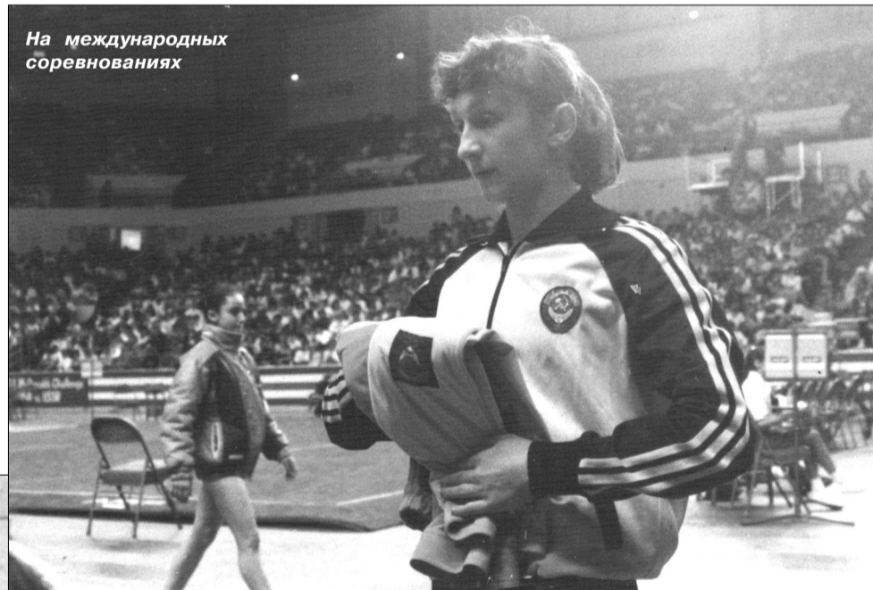
На международных соревнованиях

- Были элементы, которые страшновато было делать -