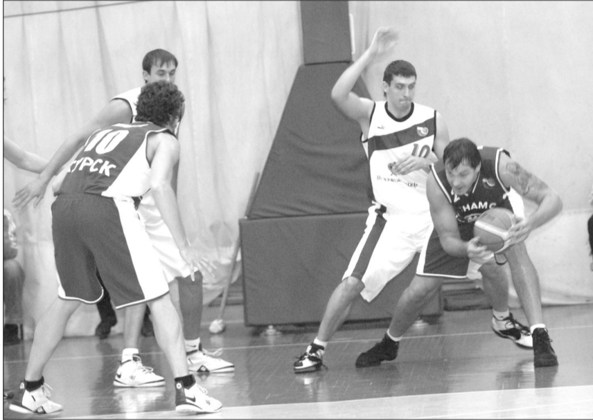
«Скифы» не стали довольствоваться малым и увезли из Курска две победы