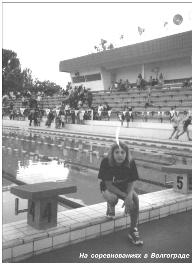
На соревнованиях в Волгограде