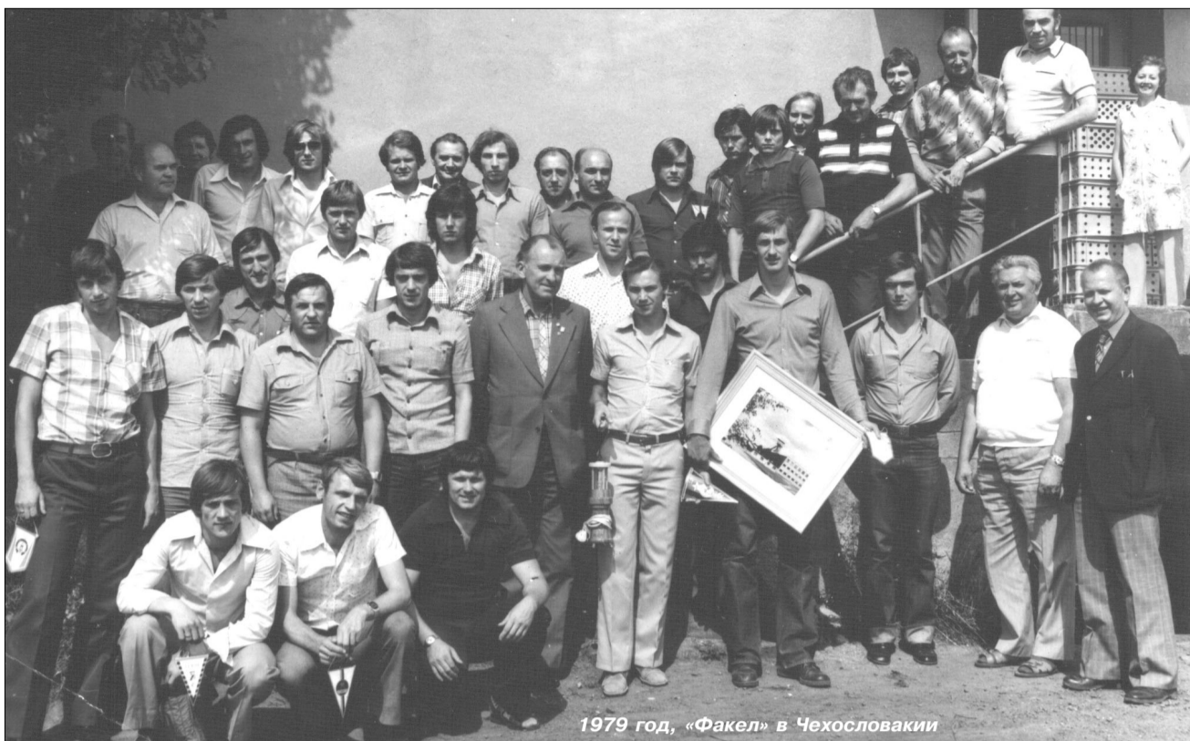
1979 год, «Факел» в Чехословакии

- Сейчас уже понимаю, что допустили ошибку, не настояв на втором варианте. А тогда решили не торопиться: поднимемся, мол, осмотримся.