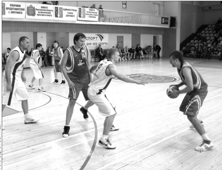
В матче за «бронзу» «скифы» сумели одолеть «Старый Соболь»

победы, но... За матч наша команда пробила 4 штрафных, тогда как соперники - 32. Думается, что комментарии здесь излишни.