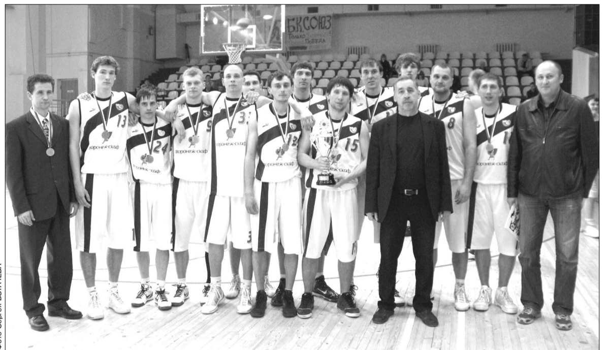
БК «Воронеж-СКИФ» - бронзовый призер высшей лиги сезона-2009/10