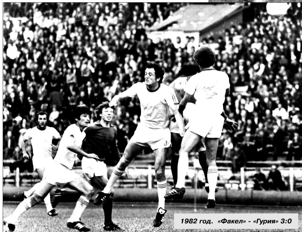
1982 год. «Факел» - «Гурия» 3:0