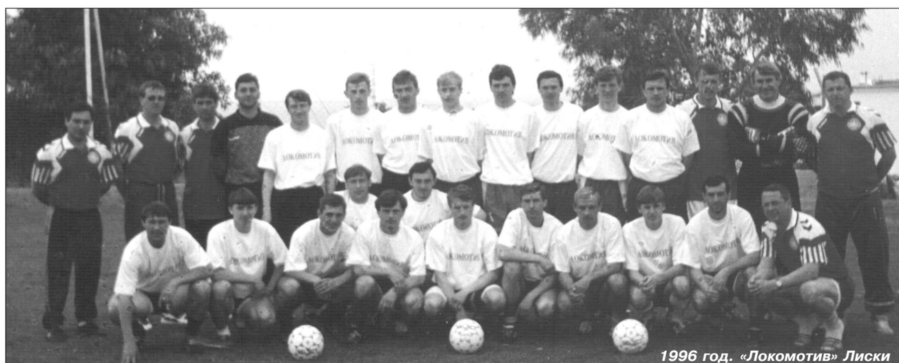
1996 год. «Локомотив» Лиски