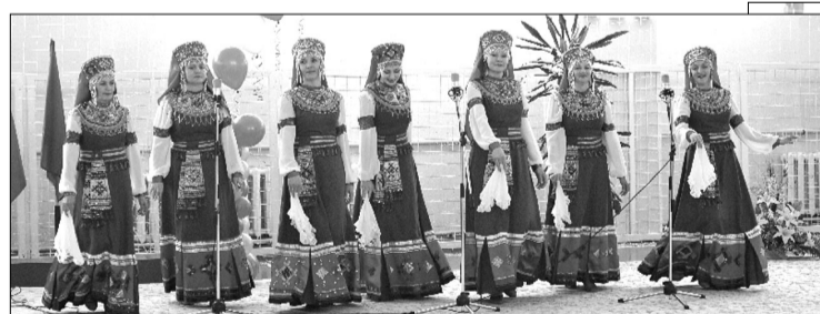
фото), акробаты, бодибилдеры, а также ансамбль народного творчества (на фото).

В рамках торжественных мероприятий в СК «Спартак» прошли чествования ветеранов спорткомплекса, лучших спортсменов и тренеров. Были подведены итоги конкурса детского рисунка, посвященного юбилею. Затем участниками праздника показательными выступлениями порадовали юные гимнастки (на