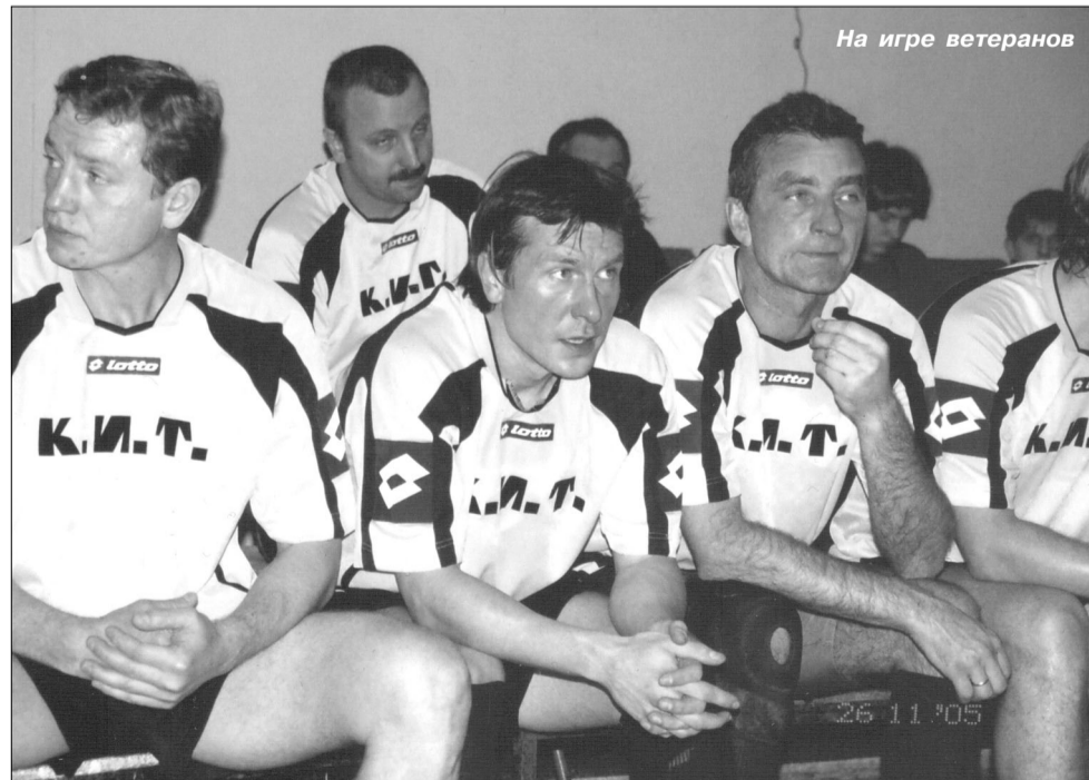
На игре ветеранов

- Вы хорошо выбирали позицию, умело играли на втором этаже. Большинство мячей забивали ногой или головой?