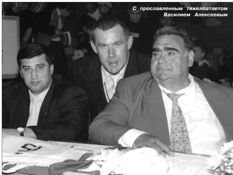
С прославленным тяжелоатлетом Василием Алексеевым

мя, много ездил по стране и за рубеж, сейчас - затишь. Гладко бывает только у того, кто ничего не делает. А когда что-то занимаешься, то всегда кому-то не нравишься. Я живу по принципу: относиться к людям так, как ты хочешь, чтобы они относились к тебе.