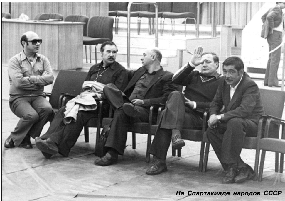
На Спартакиаде народов СССР

- Давайте вернемся к первым успехам воронежских спортсменов. В 1953 году завоевали бронзовые медали на первенстве РСФСР, что было дальше?