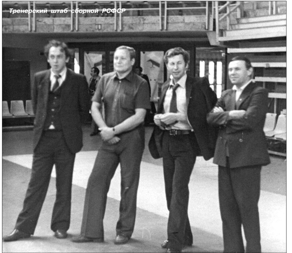
Тренерский штаб сборной РСФСР