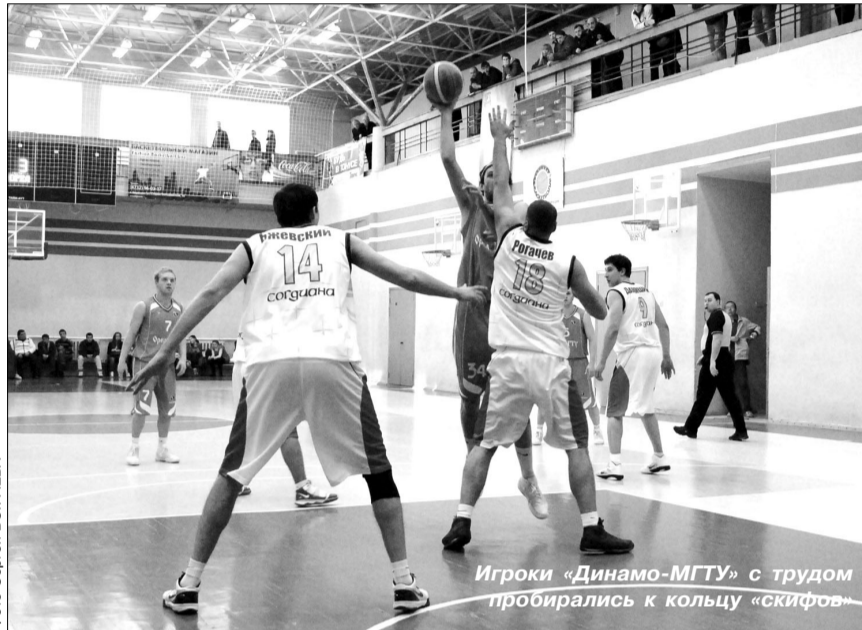
Игроки «Динамо-МГТУ» с трудом пробились к кольцу «скифов»