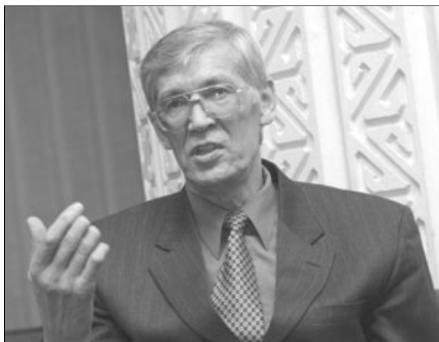
Гостем «Незабудки» в этом году станет наш прославленный чемпион - Алжан Жармухамедов

- Приедет сильный коллектив из Краснодара, который, кстати говоря, является серебряным призером ветеранского чемпионата России. Мощную команду