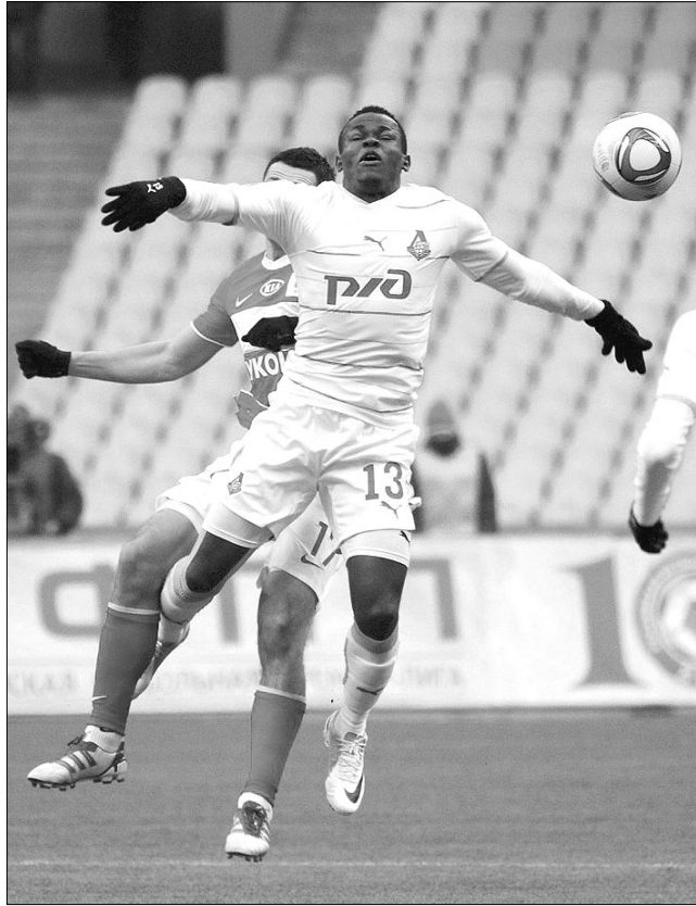
марных снах. Что же касается поединка в Ростове-на-Дону, то иного результата никто и не ожидал.

Зато порадуемся за «Краснодар», который чисто сыграл по первому сценарию. В Нижнем Новгороде Волга проиграла Каме. Столичные динамовцы довольно уверенно начали свою встречу с «Кубанью», но после пропущенного мяча с трудом удержали победу. Рязанцев вспомнил о матче с «Барселоной», правда, на «Камп Ноу» гол получился больше красивым, а в Лужниках - скорее курьезным. Голкиперу армейцев Габулову он теперь будет сниться в кош-