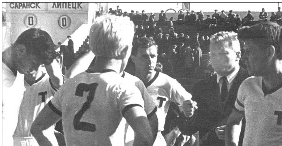
У руля липецкого «Торпедо»