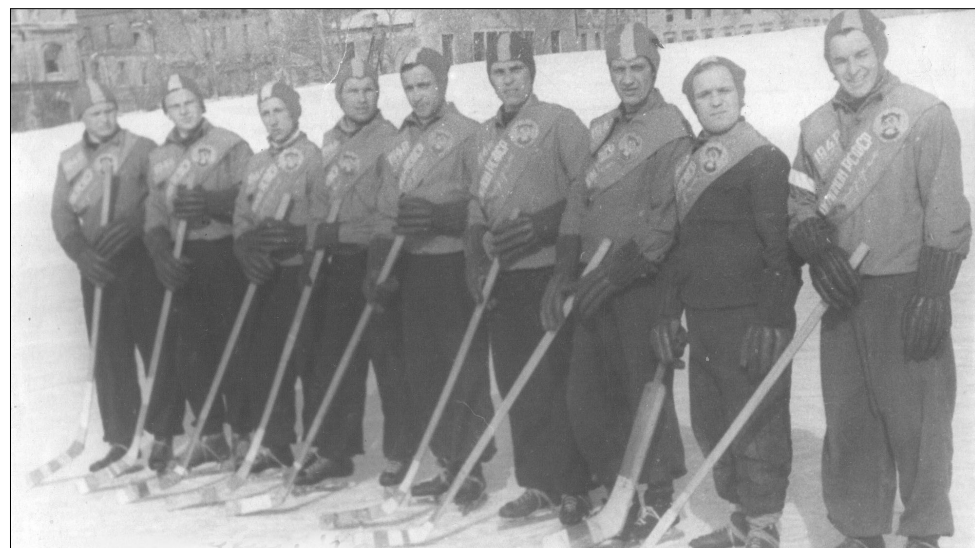
«Спартак» (Воронеж) - чемпион РСФСР по канадскому хоккею 1948 года