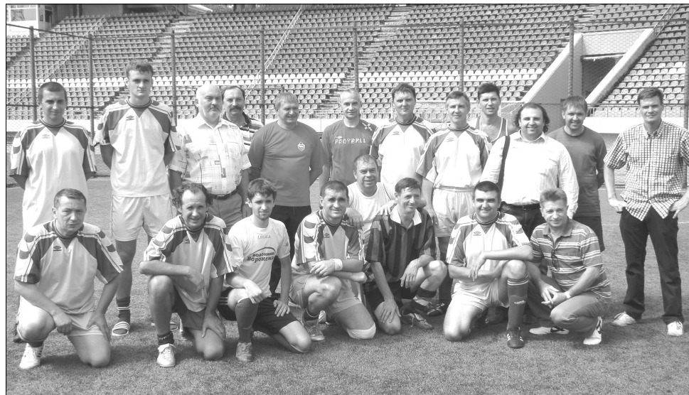
Команда руководителей «Рудгормаша» на Центральном стадионе профсоюзов

екатеринбургский «Урал», челнинский «КАМАЗ». Сегодня ФК «Рудгормаш» объединяет ветеранскую сборную, детскую футбольную школу и коллектив мо-