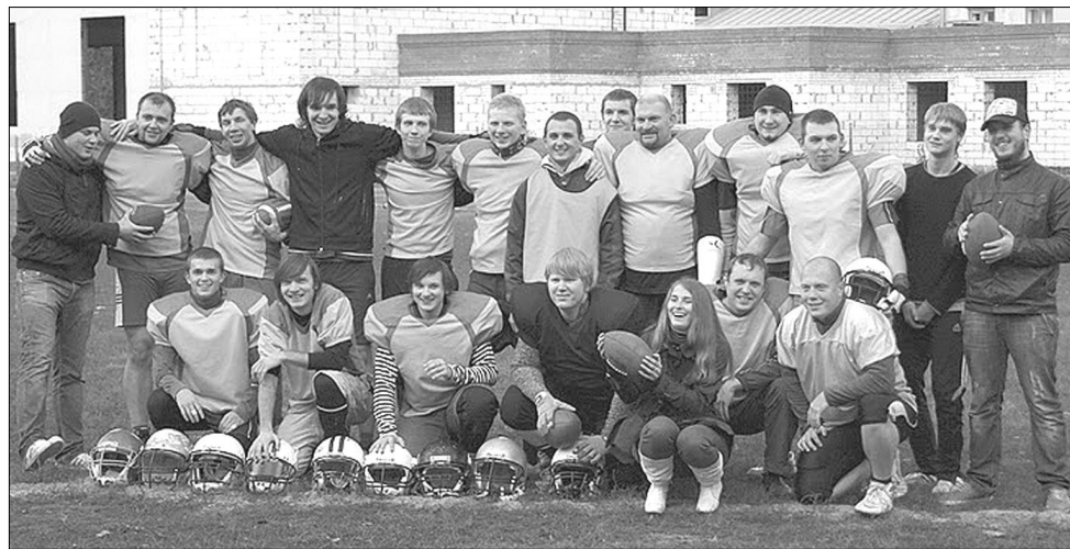
«Могучие утки» из Воронежа знают толк в американском футболе

- Все мероприятия, в том числе и выезды, оплачиваем самостоятельно. Поэтому хотелось бы найти спонсоров для развития и регистрации Федерации американ-